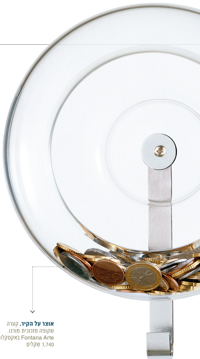
אוצר על הקיר. קערה שקופה מזכוכית מורנו. Fontana Arte באקסקלוסיב, 1,740 שקלים