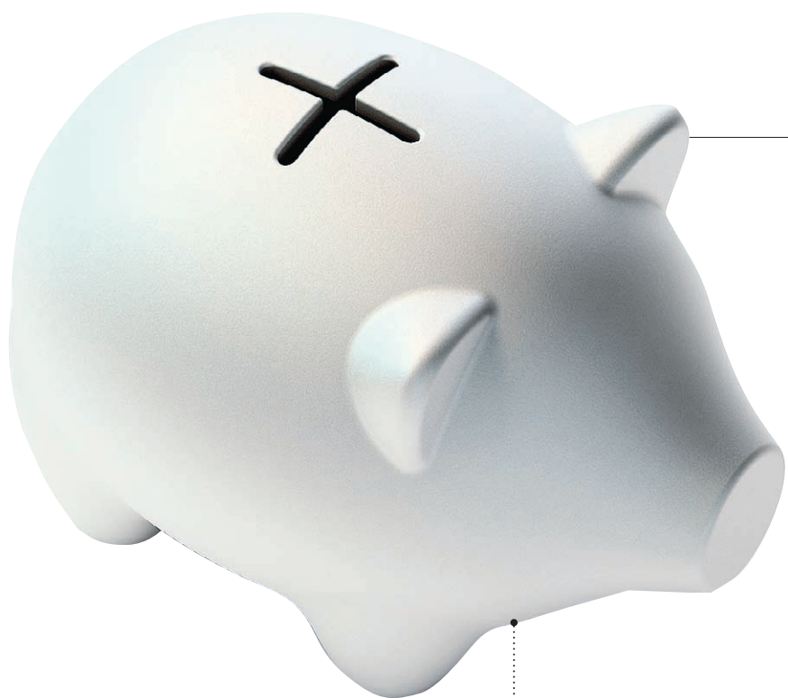
פלוס חיובי. חזרזיר לבן לקיבול מטבעות, שמוותר על המינוס הקלאסי בגב. Copilcus, www.artlebedev.com