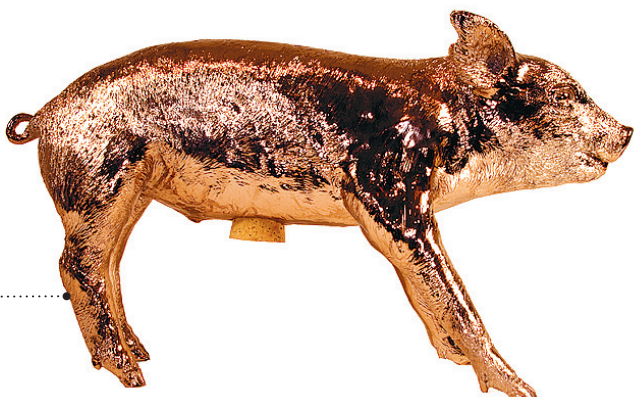
קפיטליזם חזירי. צורתה האותנטית של הקופה נוצקה מחזיר שמת בנסיבות טבעיות. מכיל עד עשרת אלפים שטרות של דולר בודד. בעיצוב Harry Allen, www.areawaer.com מ-190 דולרים